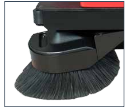
BRACCIO LATERALE SINISTRO LEFT SIDE BRUSH ARM BRAZO LATERAL IZQUIERDO