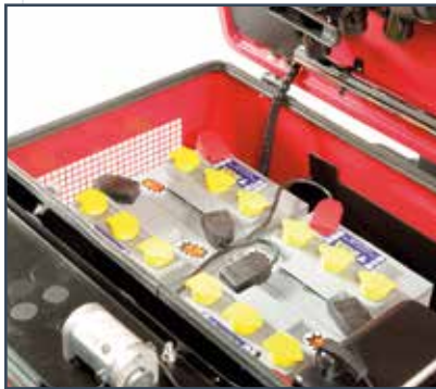
6 BATTERIE 6V-270 Ah (20h) - (E) 6 BATERÍAS 6 V-270 Ah (20h) - (E) 6 BATTERIES 6 V-270 Ah (20h) - (E)