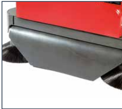
CONVOGIATORE POLVERE ENCAMINADOR DE POLVO CONVOYEUR DE POUSSIÈRE